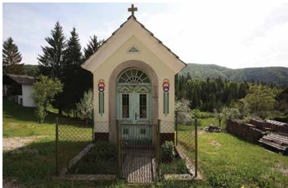
Kapelica, postavljena po zaobjubi.

Gozd se počasi približuje vasi in postaja tihi zmagovalci v boju s človekom, ki si je z velikim večstoletnim garanjem mukoma pridobil kulturno krajino – toda ne za vedno.