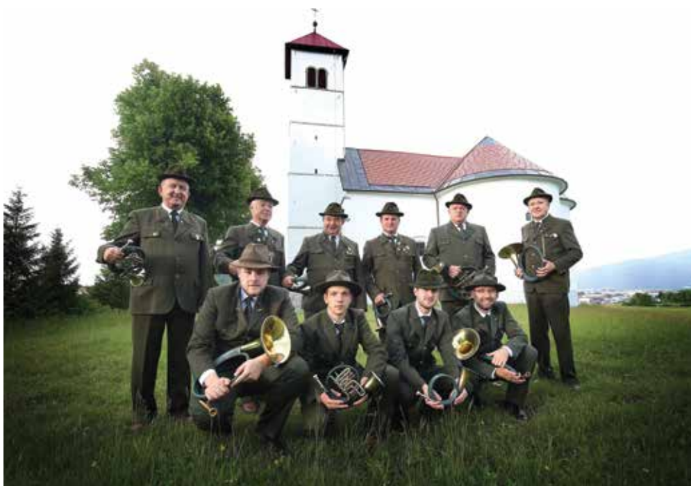
Notranjski rogisti ob 30-letnici

Lovska kultura je del tradicije slovenskega lovstva. Poleg slikarstva, rezbarstva in fotografije so nosilci lovske kulture prav gotovo lovski pevski zbori in lovski rogisti. Številni lovski pevski zbori in skupine lovskih rogistov bogatijo lovske in druge prireditve širom Slovenije in v zamejstvu. Trenutno v Sloveniji deluje preko 45 pevskih sestavov in rogistov s preko 500 članicami in člani.