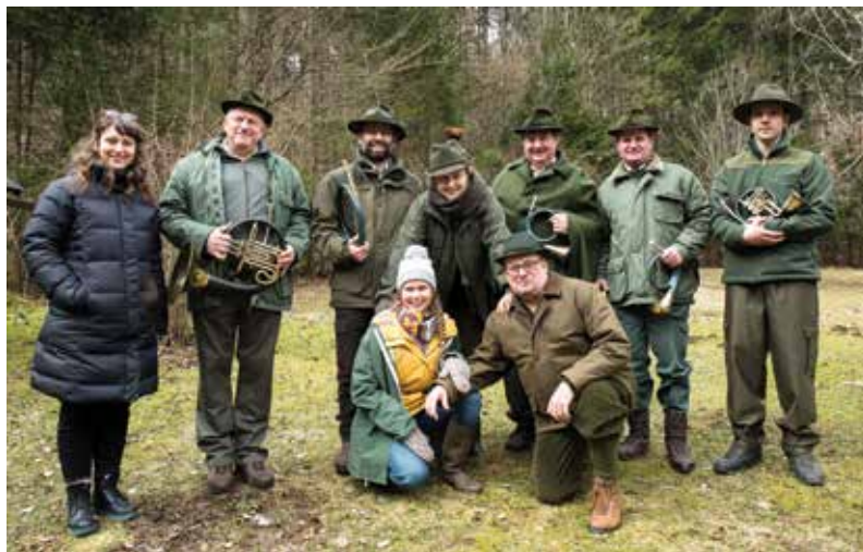
Na snemanju filma Lovka

Rogisti radi zaigramo tudi na drugih kulturnih prireditvah. Tako smo sodelovali na otvoritvi razstave Oskarja Kogoja