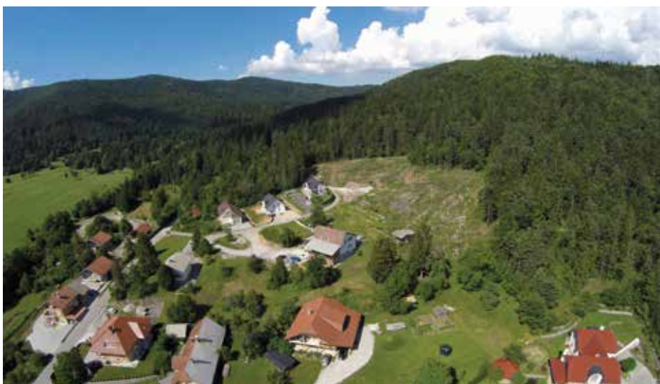
Medved prihaja vse bližje vasem.