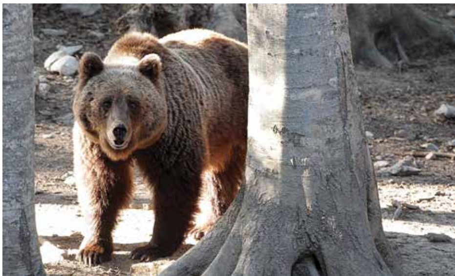
Organizacija opazovanja medvedov je zagotovo lahko dodatna oziroma dopolnilna dejavnost lovskih družin.

Bi morda mrhovišča, kot smo jih poznali včasih in so v Sloveniji prepovedana, preprečila medvedom približevanje vasem? Tako je pokazal projekt Life Dinalp Bear, pri katerem sta med drugim sodelovali tudi LD Grahovo in LD Cerknica. »V LD Grahovo so v prvem letu raziskave naredili krmišče oziroma mrhovišče, ki so ga zalagali s klavniško mrhovino. Zabeležili so obisk od pet do deset in več različnih medvedov na noč. Na območju LD Cerknica je bilo krmišče s koruzo bolj slabo obiskano,« pripoveduje sogovornik. Uradnega zaključka raziskave sicer še ni, a vse kaže na to, da bi mrhovišča omejila gibanje medvedov v iskanju hrane in s tem približevanja ljudem. Sicer »mrhovišča« za naravne izgube obstajajo za tako imenovane SŽP (stranske živalske proizvode). »V kolikor lovci najdejo od prometa ali zveri pokončano divjad, kadavre in ostale ostanke, jih lahko odpeljejo na t. i. mrhovišča SŽP – iz narave v naravo,« pojasni Kovačič.