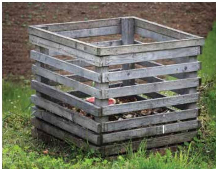
Odpadki ne sodijo v naravo.

manj izpostavljeni toploti, kisiku in razkrojevalcem, razkroj bo počasnejši in neprijeten vonj manj izrazit. Pomembno pa je, da jih ne odlagate v plastičnih vrečkah, ki zelo motijo proces nadaljnje obdelave in predelave v kompost.