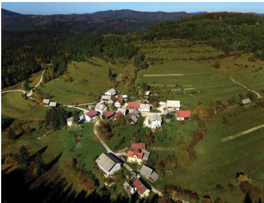
Pod vasjo teče Mahneč potok, pritok Cerkniščice.

Ob vodi, ki teče pod Mahneti, je bil najprej Mahneški mlin, potem pa še Podslivniški in Otoniški. Marija Primožič pravi, da je bil » Mahneč maln strašan,